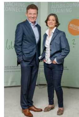
FENDEL & PARTNER UNTERNEHMENSBERATUNG